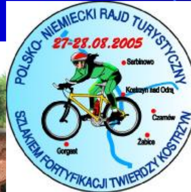
KOSTRZYŃ NAD ODRĄ