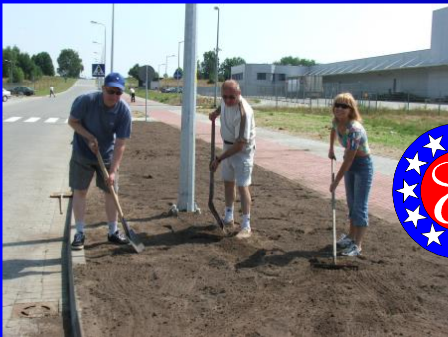
W czasie pracy